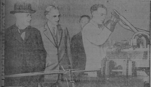
Con motivo de la exposición anual de automóviles celebrada en Nueva York, fueron ganadores las personas notables que la visitaron. Aquí vemos a Tomás Alva Edison y a Henry Ford, inspectores de una máquina de soldar que produce "botingos".