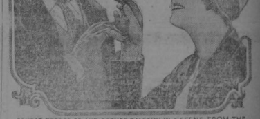
ERNEST TORRENCE AND ESTHER WALTON IN "SCENE FROM THE VICTOR FILMING WORKS.

Y a las 8. 30 p. m. reata fumos hoy en el Moderno que sin duda llevarán al amplio coliseo de gala con su soberbio escenario "monumt" que se titula "LA CIEGA obra dramática de tres actos de bellas escenas cinematográficas que sin duda a noche se exhiben. Como decíamos, este domingo habrá 5 selectas funciones que llamarán poderosamente la atención y serán 5 seguros éxitos.