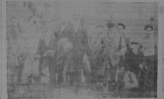
El Coronel Carlos A. Lindbergh, famoso aviador norteamericano por sus largos vuelos sin escalas, fué obligado a aterrizar en Coahuila a la Capital nacional Norteamericana. Aquí lo vemos rodeado por sus largos vuelos sin escalas, en un vuelo que hacía en camino de admiradores.